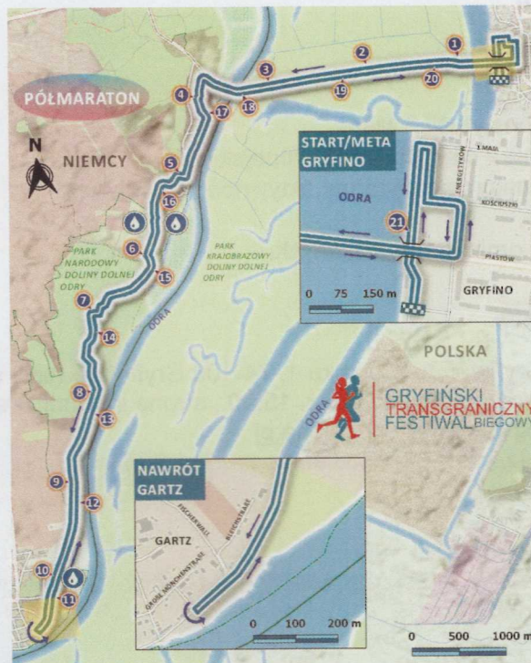
PROFIL TOPOGRAFICZNY GRYFIŃSKIEGO BIEGU TRANSGRANICZNEGO - PÓŁMARATON