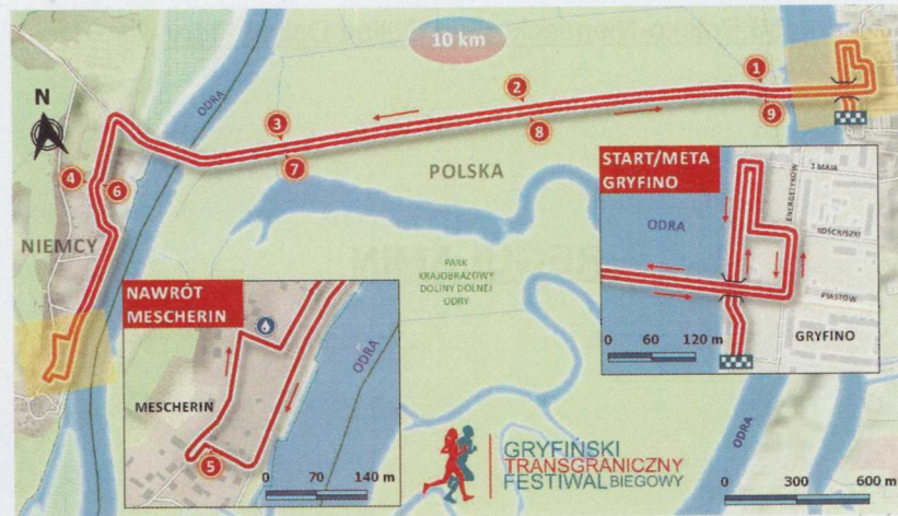
PROFIL TOPOGRAFICZNY GRYFIŃSKIEGO BIEGU TRANSGRANICZNEGO - 10 KM